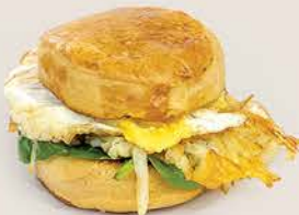
BISQUET INGLÉS & CAFÉ DEL DÍA

Bisquet inglés artesanal hecho sándwich con una base de espinaca, papa hash Brown, salteado de champiñón y un huevo estrellado.