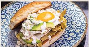
TORTA DE CHILAQUILES