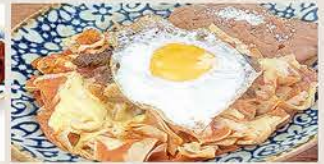
CHILAQUILES CON HUEVO