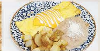
OMELETTE LOS ALAMOS