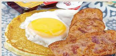
DESAYUNO JUNIOR $98 1 Huevo, Hot cake y Tocinete