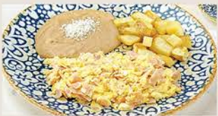
HUEVOS AL GUSTO