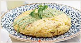
TORTILLA ESPAÑOLA RELLENA