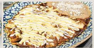
CHILAQUILES EN CHILE GUAJILLO

Nopales, 2 huevos, chilaquiles adobados, lomo canadiense