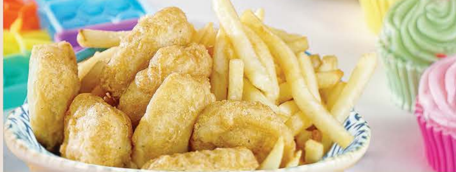
NUGGETS CON PAPAS $98