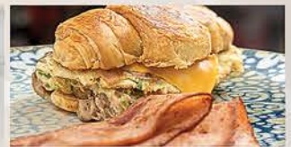
SUPER SANDWICH OMELETTE