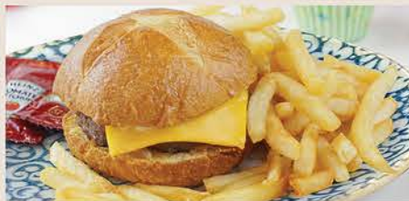
HAMBURGUESA CON PAPAS $98