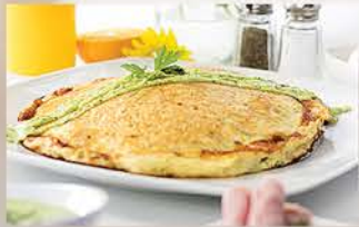
TORTILLA ESPAÑOLA RELLENA