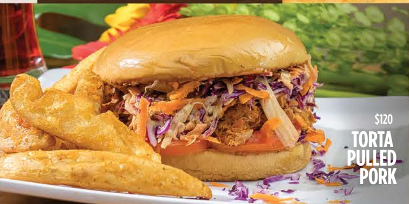
$120 TORTA PULLED PORK