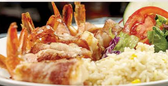
CAMARONES A LA BOSTON $225 Envueltos con tocino y rellenos con queso