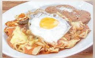
CHILAQUILES CON HUEVO