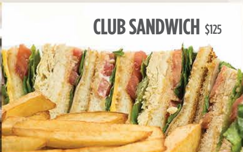
CLUB SANDWICH $125