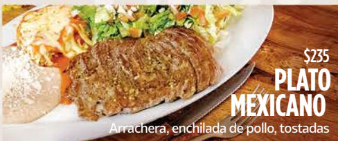
$235 PLATO MEXICANO

Lengua a la Veracruzana $275 Tostadas de atún natural $175 4 pzas.