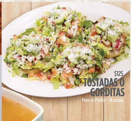
$125 TOSTADAS O GORDITAS

Arrachera, enchilada, quesadilla, frijoles