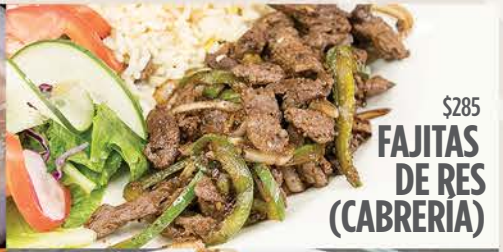
$285 FAJITAS DE RES (CABRERÍA)