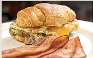
SUPER SANDWICH OMELETTE SUPREMO