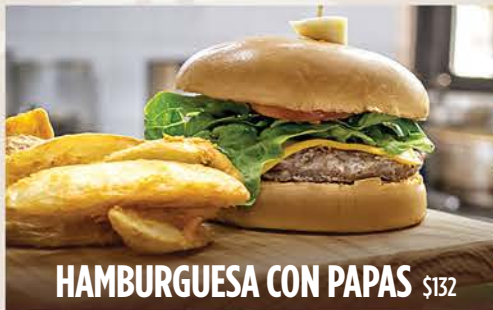
HAMBURGUESA CON PAPAS $132