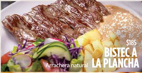
$185 BISTEC A LA PLANCHA