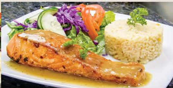
SALMÓN AL MANGO $255