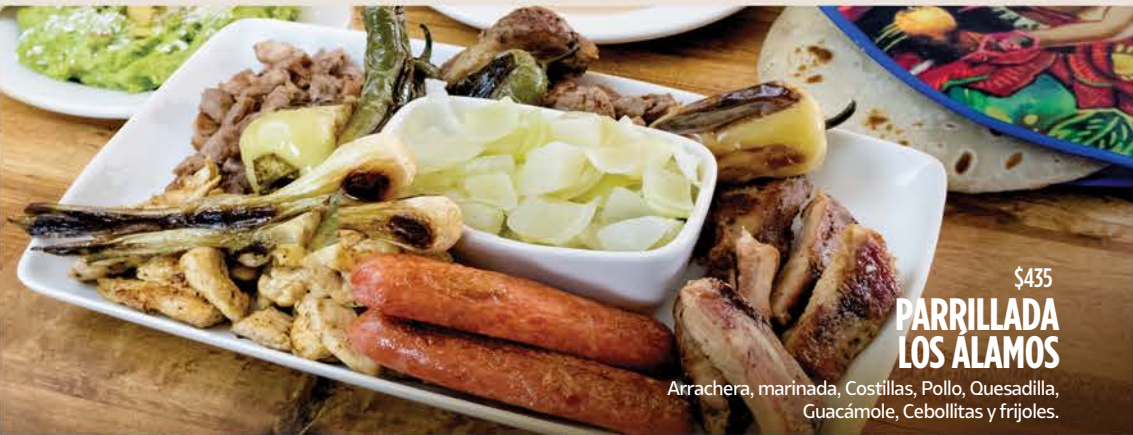
$435 PARRILLADA LOS ÁLAMOS

Arrachera, marinada, Costillas, Pollo, Quesadilla, Guacámole, Cebollitas y frijoles.