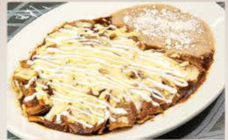
CHILAQUILES EN CHILE GUAJILLO

Nopales, 2 huevos, chilaquiles adobados, lomo canadiense