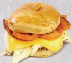
BISQUET INGLÉS & CAFÉ DEL DÍA

Bisquet inglés, artesanal en sándwich con un huevo en torta, rebanadas de tomate, queso americano y tocino. $78