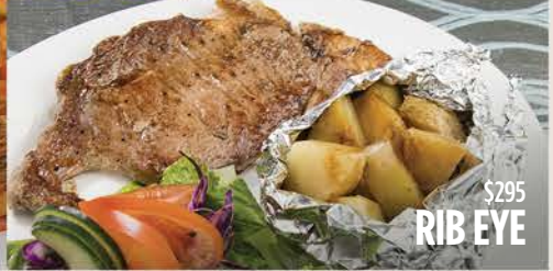
$295 RIB EYE

Milanesa de Ternera $175 Filete c/papas Francesas $285 Cabrería