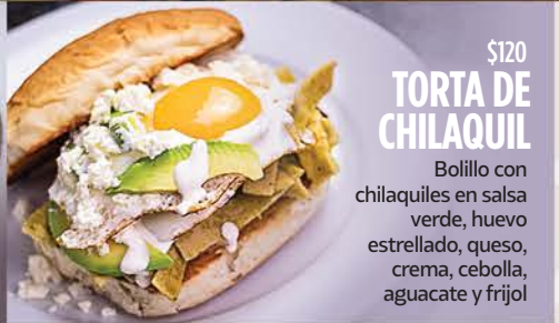
$120 TORTA DE CHILQUILE

Chile poblano relleno de tamal de elote y chilorio gratinado, salsa de frijol y crema