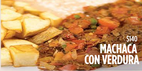
$140 MACHACA CON VERDURA