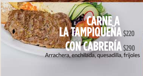
CARNE A LA TAMPIQUENA $220 CON CABRERÍA $290

Arrachera, enchilada, quesadilla, frijoles