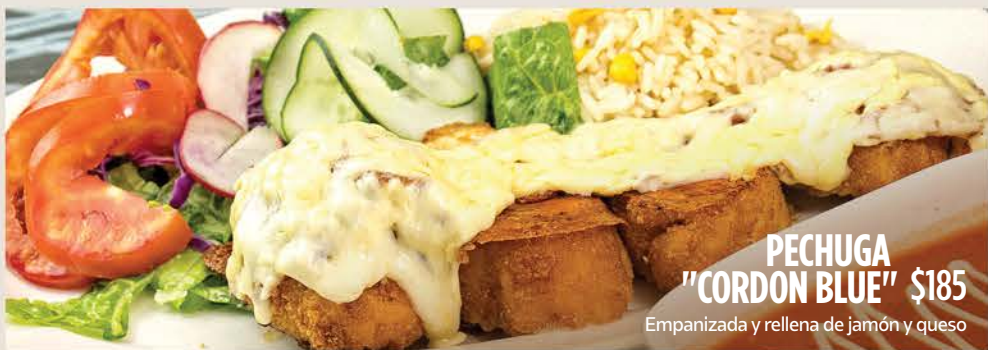
PECHUGA "CORDON BLUE" $185 Empanizada y rellena de jamón y queso