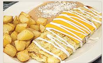
OMELETTE LOS ALAMOS

Deshebrada de Res, queso chihuahua-amarillo y papas