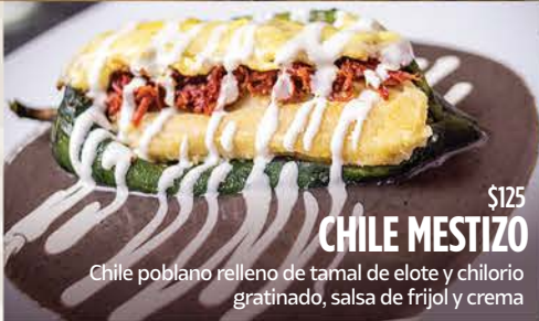
$125 CHILE MESTIZO

Arrachera, marinada, Costillas, Pollo, Quesadilla, Guacámole, Cebollitas y frijoles.